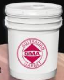
MICRO Blast 200 Garnet