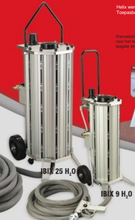
IBIX 25 H 2 O